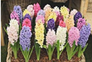
Гиацинты в Челси. Англия

В последнее время стал распространяться экологический туризм. Весна в саду – самое красивое время года. Существуют списки, в какой стране в какое время начинается пора цветения растений. Энтузиасты собираются в небольшие группы и стараются застать этот чудный, но недолгий период, когда парки и сады становятся райскими кушцами. Давайте и мы совершим виртуальное путешествие, тем более что скоро женский праздник, а нам так приятно любоваться цветами.