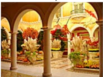
Дворик в Лас-Вегасе. США

К весеннему «показу» своих достижений готовятся ботанические сады всего мира. Законодатель зеленой моды – самая престижная и популярная выставка в Челси (Англия) . С 1922 года она проводится под патронажем британской королевской семьи. На выставке представлены дизайнерские сады, палисадники, декоративная скульптура... Мы посмотрим только цветочную композицию.