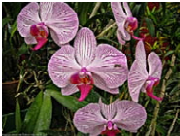
Орхидеи на Цейлоне