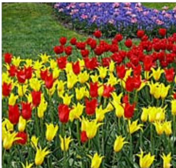
Тюльпаны в Голландии