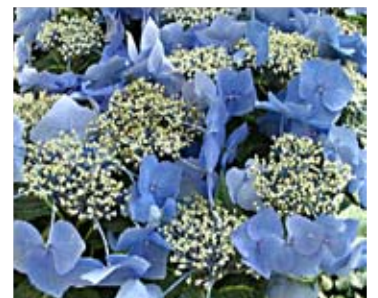
Ботанический сад на Аляске