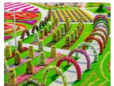
Самый большой в мире ботанический сад в Эмиратах