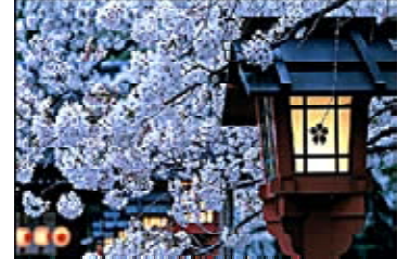
Япония. Сакура цветет

Путешествовала по Интернету Алла КАЗАНЦЕВА.