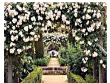
Сад роз в Англии