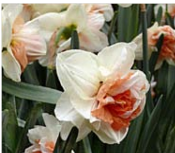
Махровый нарцисс в Московском ботаническом саду